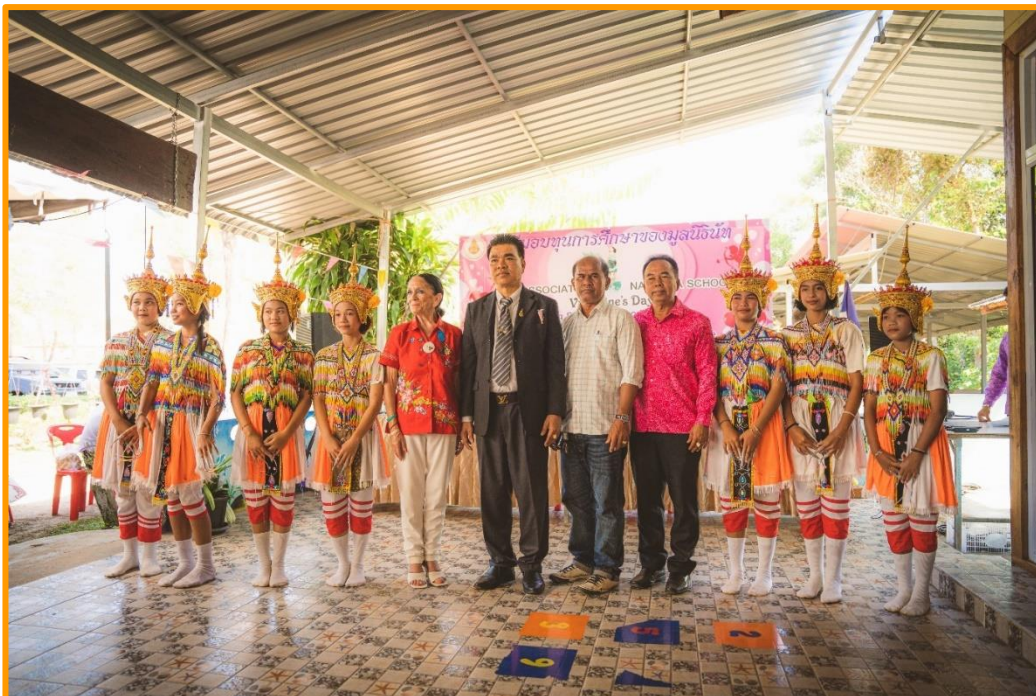
Nos danseuses de Manora très appréciées