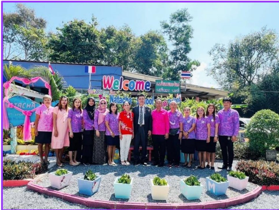
Belle équipe de Natacha School (y compris un futur élève !)