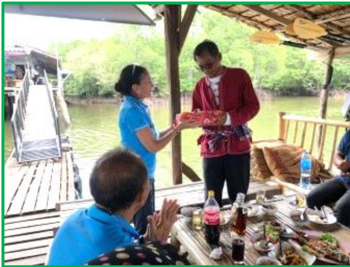
Cadeaux pour une retraite bien méritée