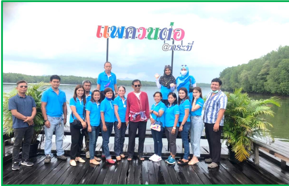
Début de retraite sous le début de la mousson