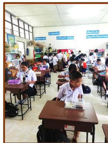
La cantine se fait encore dans la classe...

Nous avons, grâce aux dons reçus de T.P.Q.I. (CF Newsletter n° 22) distribuer des jouets aux plus petits pour empêcher les larmes du 1 er jour ! Cela m'a ramenée 17 ans en arrière lors de notre première distribution ! Le temps passe... Et les petits n'ont pas conscience qu'ils en ont pour 15 ans devant eux... Minimum !