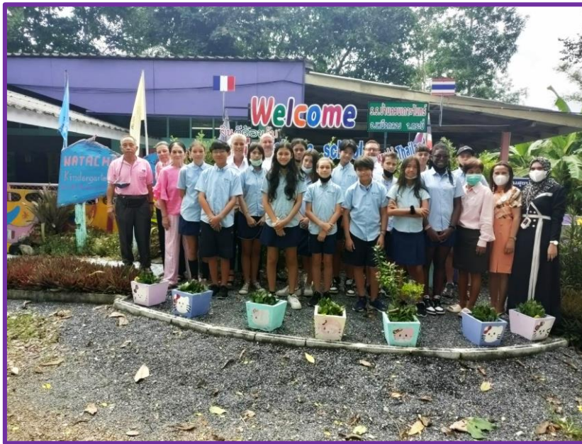
Bienvenue à Natacha School