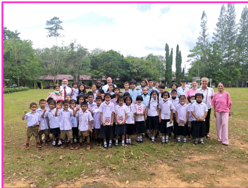
Ce n'est qu'un au revoir. A bientôt à Phuket.