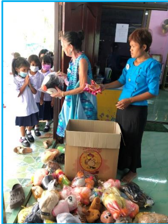
Distribution pour éviter les larmes du 1 er jour ! (Vendredi est bleu en Thaïlande )