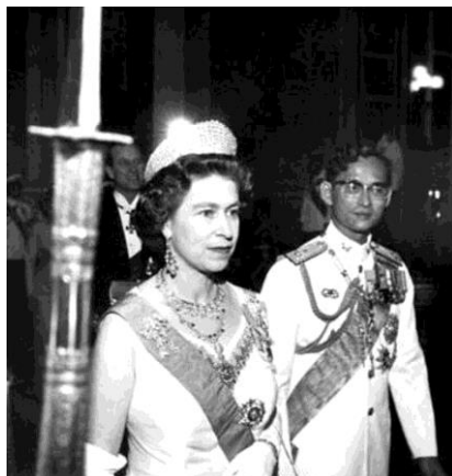
Sa Majesté la Reine Elizabeth II, Sa Majesté le Roi Rama IX.

Si, pour vous tous, le mois de septembre est synonyme de rentrée, à Natacha School comme dans toutes les écoles de Thaïlande c'est le mois consacré aux premiers tests de mi-année, avant les vacances qui séparent les 2 semestres ; cette année à partir du 14 octobre et jusqu'au 2 Novembre (le 13 octobre étant férié pour l'anniversaire du décès de Sa Majesté le Roi Rama IX).