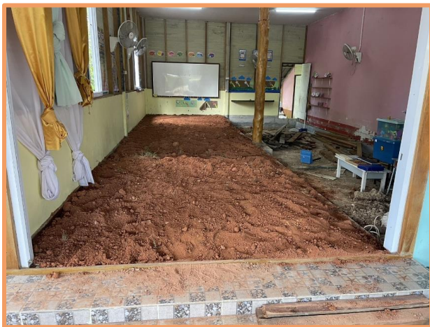
Nivellement du sol