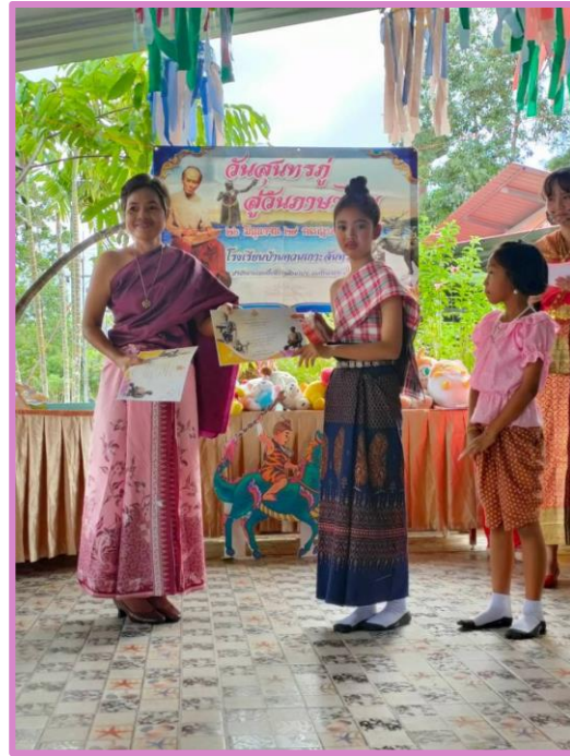
En arrière-plan, photo du poète