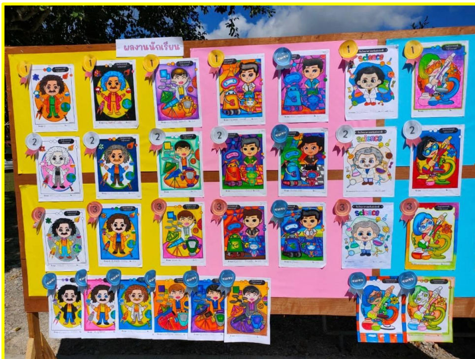
La Science illustrée

Nous ne sommes plus dans l'illusion mais dans la Physique et la Chimie... un peu magiques aussi !