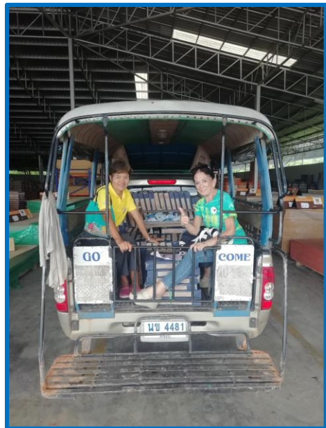
Sortie du magasin de bricolage