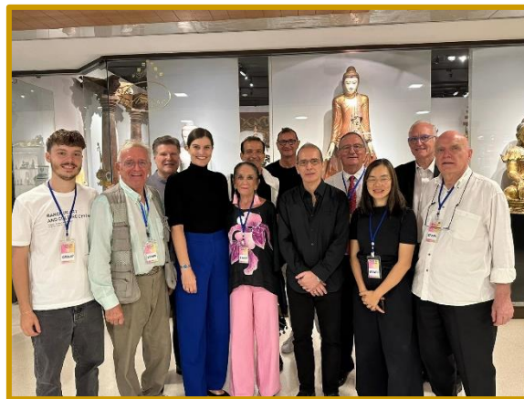
De gauche à droite au premier rang :