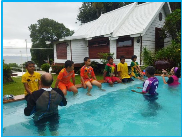
On va apprendre à mettre la tête sous l'eau