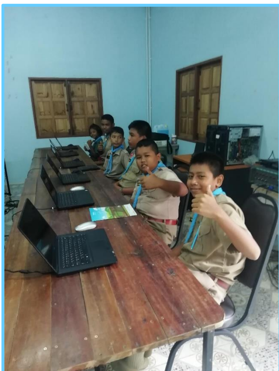
C'est super le surf