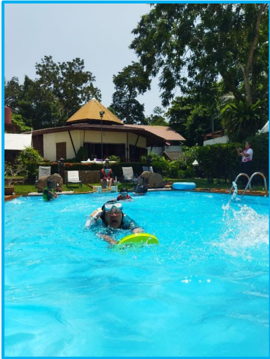
Non personne n'a bu la tasse !