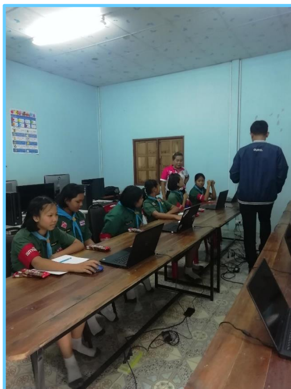
Et la créativité aussi