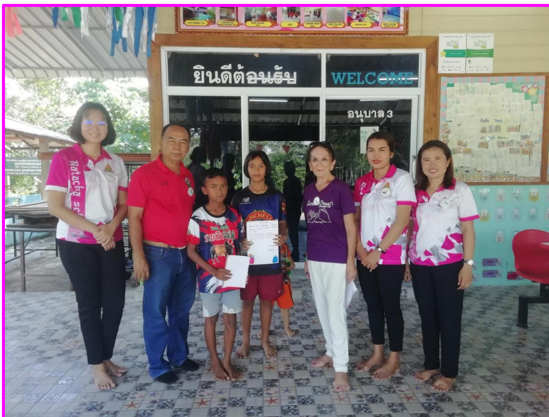
Début du parrainage pendant que notre ami se remet de ses émotions