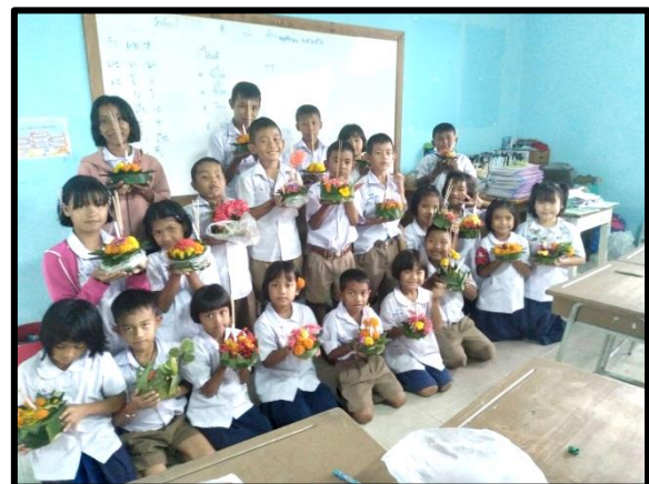
Chefs d'œuvre prêts à voguer