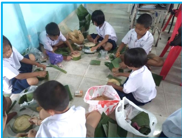
Fabrication des Kratongs