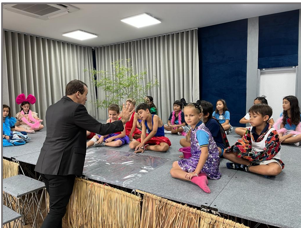
Répétition générale avant le 1 er spectacle à Koh Samui