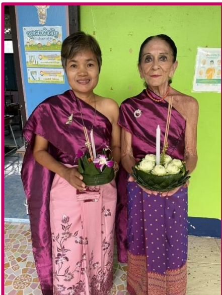
Prêtes à parader