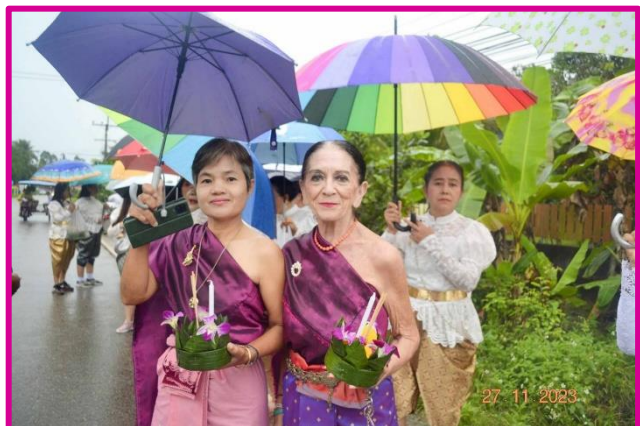
Just singing (and dancing) in the rain

La prochaine Newsletter, n° 42, sera publiée fin janvier 2024 mais