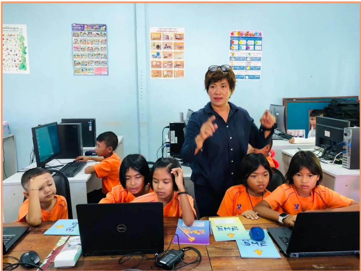
Ici une classe de P3, équivalente de notre CE 2