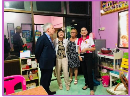
Dans le bureau de NAT Association, découverte du tableau où vont s'ajouter 2 photos