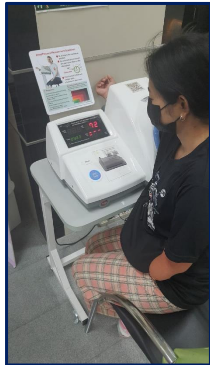
Empreinte pour une vie meilleure