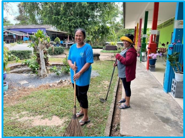
Mamans venues aider au grand nettoyage de l'école