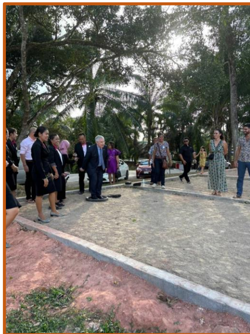
Quelques jours après l'inauguration du terrain de pétanque, Son Excellence monsieur l'Ambassadeur Jean-Claude Poimboeuf lors de sa visite officielle à Natacha School, a accepté gentiment de tester ce nouveau terrain de sport tellement apprécié en Thaïlande.