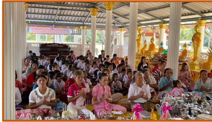
Beaucoup d'émotion dans ce temple chargé de souvenirs