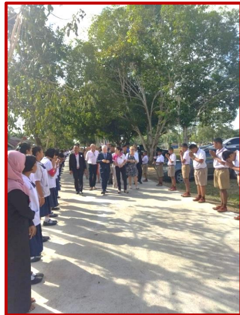
Arrivée officielle et accueil chaleureux