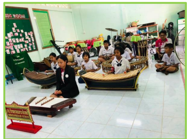
Nos artistes célébrés par l'ambassadeur et ses accompagnants