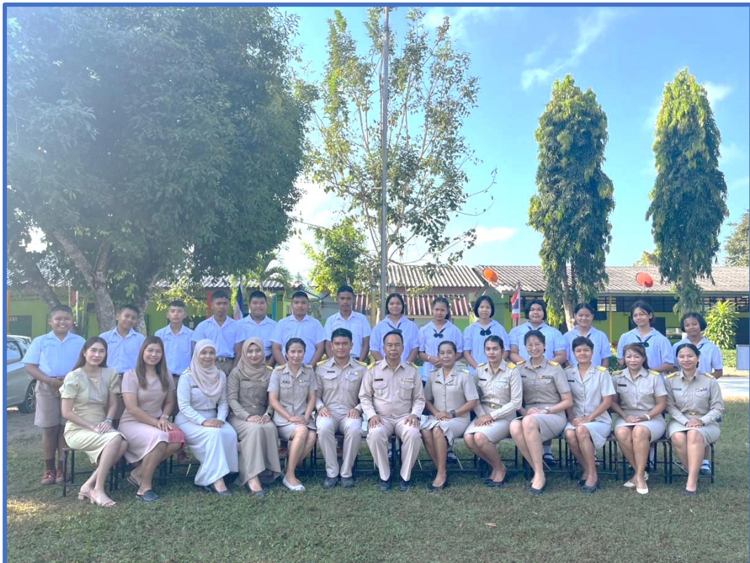
Photo traditionnelle des futurs collégiens et de l'équipe pédagogique